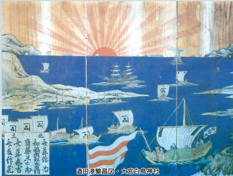
酒田港繁昌図・大宮白鳥神社

開催期間 平成4年7月16日(木)～9月27日(日) 開館時間 午前9時～午後4時30分 休館日 なし 入館料 おとな100円・児童生徒50円 65歳以上の方と身体障害者の方 方は無料です。