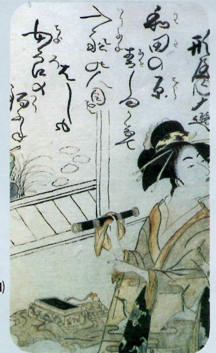
百人女姿・さかたごひいき いままち女子しゅ