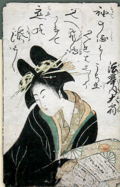
◀ さかたごひいきいままち女子しゆ