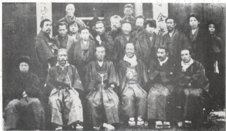
▲医会所十全堂の落成式 明治16年 (酒田地区医師会十全堂提供)