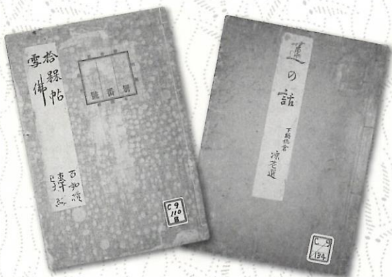
▲商人たちが歌を詠んだ俳句本 『拾翠帖』『蓮の話』(酒田市立光丘文庫蔵)