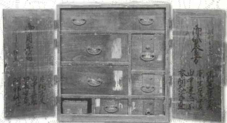
▲本間光丘が使用した御用筆筒