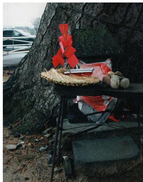
▲妙法寺に供えられた麻疹送りの御幣

村の境に供えたのは、村の外に悪神である疫病神を送り出すためです。道祖神信仰にも共通していますが、村という共同体を悪いものから守る意味で、村を分ける境界をとっても大切な場所と考えていたことを示しています。