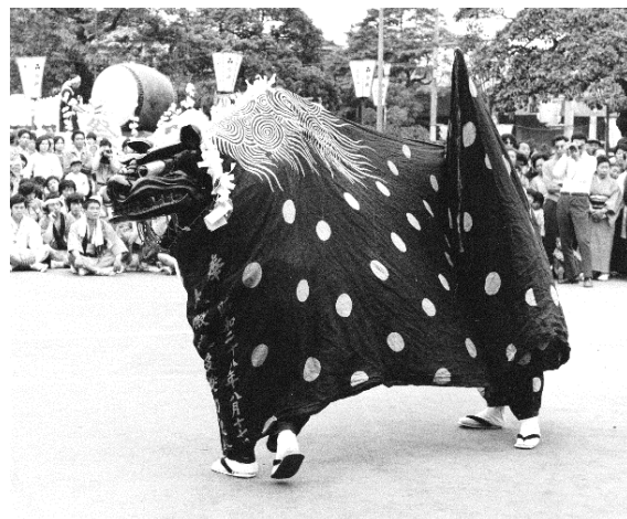
山王祭で奉納された亀ヶ崎獅子舞

また、獅子舞に限定せず神楽全体を見ると、西野神代神楽や落野目神代神楽などは明治の疫病流行を受け、一時衰退していた神楽を復活させたとされています。このように、酒田の獅子舞や神楽は、疫病と関係が深いものが多いです。