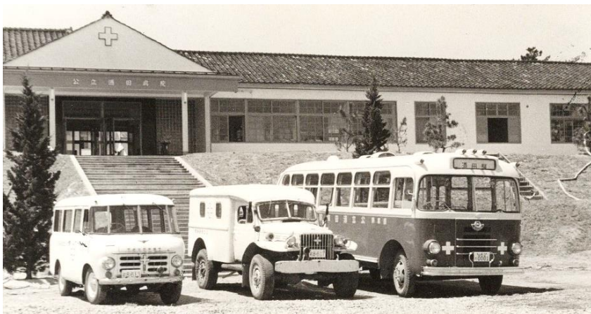
公立酒田病院 昭和30年代

昭和35年(1960)に社会保険酒田病院と統合して市立酒田病院になり、平成20年(2008)には県立日本海病院と再編・統合して、日本海総合病院になっています。