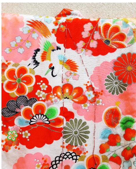
▲背守り入り幼児用着物

病気を乗り越えられるように——。病気にかからないように——。そんな家族の祈りはさまざまな形になっています。