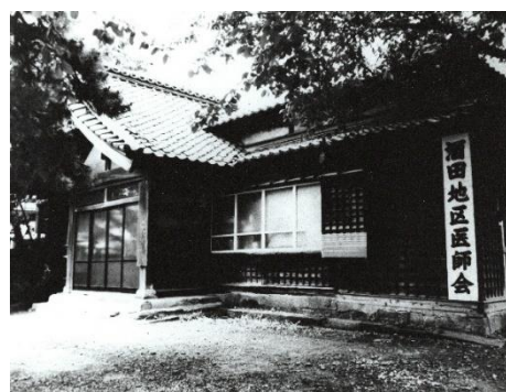
平成元年(1989)ころの十全堂

種痘はのちに定期接種の対象になりましたが、昭和55年(1980)に、天然痘が世界から根絶されるとともに廃止されました。