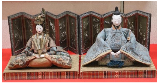
田中家の古今雛（京都製） 江戸後期～明治初期

田中家は元禄期(1688～1704)から続く旧家で、昭和期までは酒蔵「舞鶴」を営んでいました。内裏雛の一方は江戸製、もう一方は京都製です。