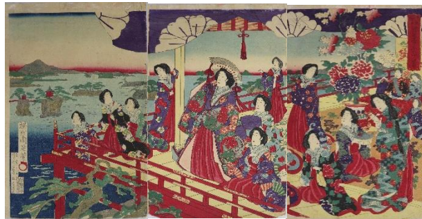
絵紙「陸奥松島観覧亭ヨリ千島ノ眺望」 揚州周延作/明治時代