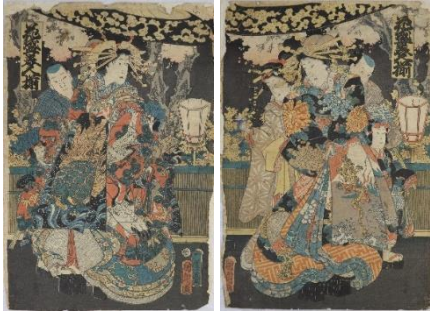
絵紙「花盛り美人揃」/豊原国周作/明治時代

お雛様と一緒に飾る品物は各家庭によってさまざまですが、絵紙(錦絵)も好んで飾りました。華やかな女性たちや各地の名所、歌舞伎の名場面などを題材にした版画絵です。