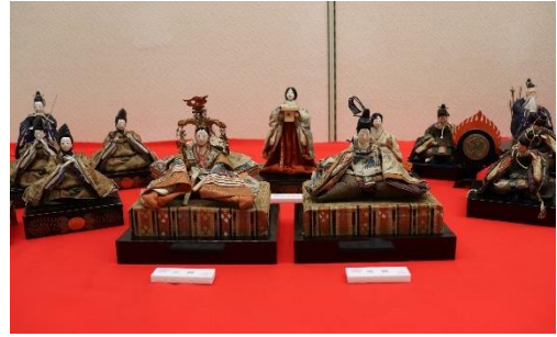
橋本家の芥子雛/明治時代

橋本家は酒田の銘酒「上喜元」の酒造元です。雛祭りの季節は杜氏をはじめ蔵人たちが酒造りに勤しむ時期です。戦前から、お雛様が橋本家のお座敷に飾られるのを楽しみに、お雛見に訪れる人が多かったそうです。古今雛のお内裏様は、江戸時代後期に制作された人形と思われ、頭部は京都製、胴体は江戸製です。その他の人形は明治時代に作られたと思われる。また、明治時代の制作と思われる芥子雛もあります。