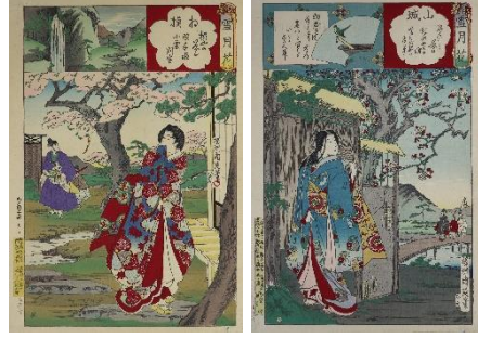
絵紙「雪月花」/揚州周延作/明治時代