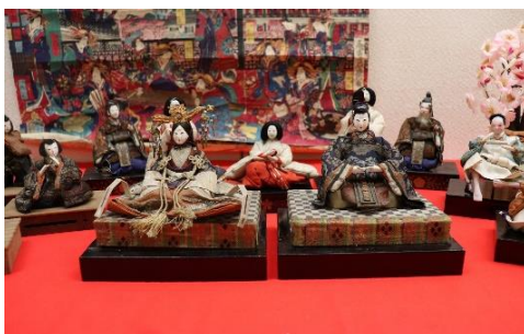
宇野家の芥子雛/明治時代

鶴岡の旧庄内藩士の家に伝わったという古今雛です。古今雛は江戸時代の後半に製造が始まりました。江戸・池ノ端の大榎屋半兵衛が江戸を代表する名工・原舟月に作らせて売り出しました。それまでの雛の衣装を一層華やかにして、金糸・色糸などで縫いとりをほどこして仕上げしており、顔も写実的で眼にガラスなどをはめ込み精巧に作られています。江戸好の雛人形として大流行し、上方でも人気を得ました。古今雛という名前は大榎屋が売り出すときに付けた、いわゆるブランド名です。