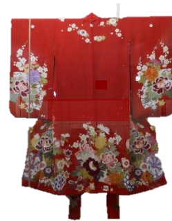
紅地梅牡丹模様振袖/昭和期

昔は商家などに飾られたお雛様を、地域の子どもたちが見てまわる「雛巡り」という風習がありました。お雛様を眺めながら、甘酒やお菓子をご馳走になったりしたのでしょう。こうした綺麗な着物を着て出かけたのかもしれませんが。