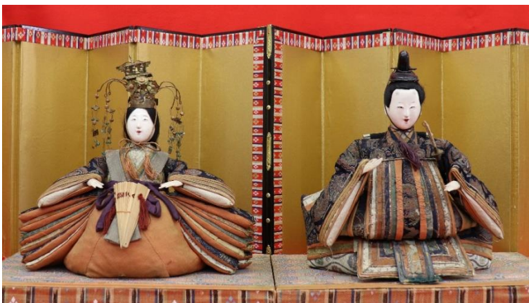
享保雛／江戸時代／資料館寄託

お雛様の中には、江戸から陸路を通して運ばれたものもあるとされています。資料館のお雛様が具体的にどのように運ばれたのか、北前船によるのか陸路であったのかは残念ながら分かりません。陸路で運ばれた場合は、壊れないように部品ごとに細かく分け、丁寧に包んで運び、酒田で組み立てて販売されたそうです。