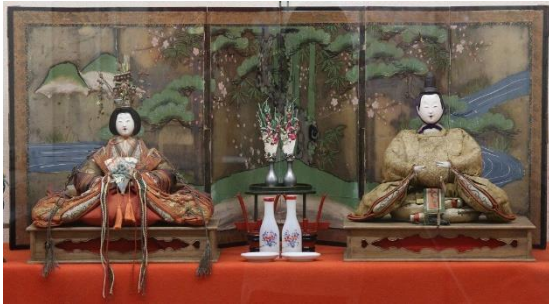
橋本家の古今雛/江戸時代後期