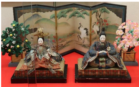
古今雛/江戸～明治時代

橋本家は酒田の銘酒「上喜元」の酒造元です。雛祭りの季節は杜氏をはじめ蔵人たちが酒造りに勤しむ時期です。戦前から、お雛様が橋本家のお座敷に飾られるのを楽しみに、お雛見に訪れる人が多かったそうです。古今雛のお内裏様は、江戸時代後期に制作された人形と思われ、頭部は京都製、胴体は江戸製です。その他の人形は明治時代に作られたと思われる。また、明治時代の制作と思われる芥子雛もあります。