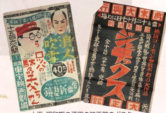
大正・昭和期の酒田の映画館のポスター