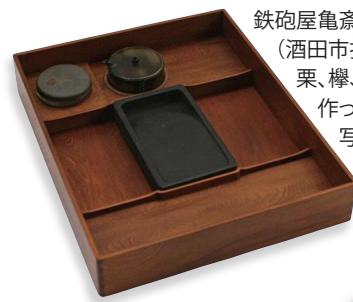
鉄砲屋亀齋「十種木硯箱」/明治 (酒田市指定文化財)

栗、樺、黒柿など10種類の木材で作った10個1組の硯箱。 写真は杉。 ※4月28日(金)~5月7日(日)の期間限定で展示します。