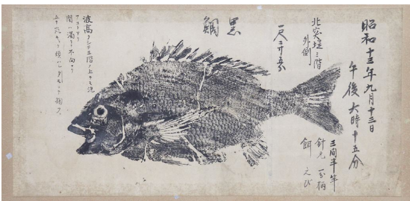
クロダイの魚拓/昭和13年(1938) 江戸時代の庄内で、武士のたしなみとして広まった釣り。庄内藩発祥の魚拓は、庄内竿とともに庄内が誇る伝統文化です。