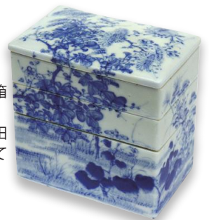
有栖川宮熾仁親王の御用弁当箱/年代不明

栗、樺、黒柿など10種類の木材で作った10個1組の硯箱。 写真は杉。 ※4月28日(金)~5月7日(日)の期間限定で展示します。