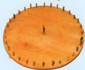
さんだわらあみだい