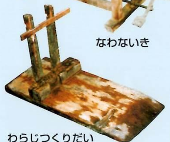
わらじつくりだい