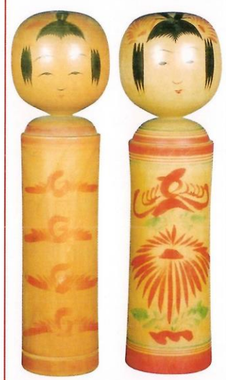
高橋 武蔵 1尺2寸4分 本間 留五郎 1尺5分