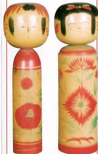
木村 吉太郎 1尺 秋山 慶一郎 1尺