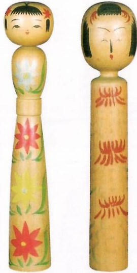
すずまご 煤孫 実太郎 1尺 安保 一郎 1尺1分