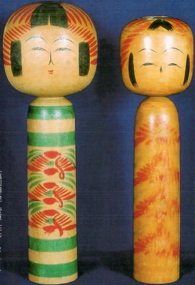
〈遠刈田系〉菅原 庄七 1尺3寸5分