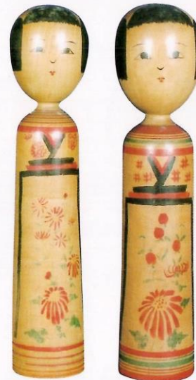
小椋 嘉市 1尺1寸 小椋 嘉市 1尺1寸