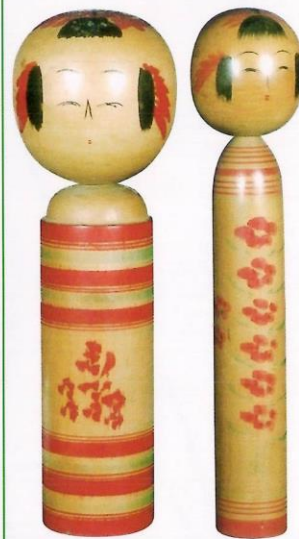
小椋 吉兵衛 8寸 小林 友治 1尺1寸1分