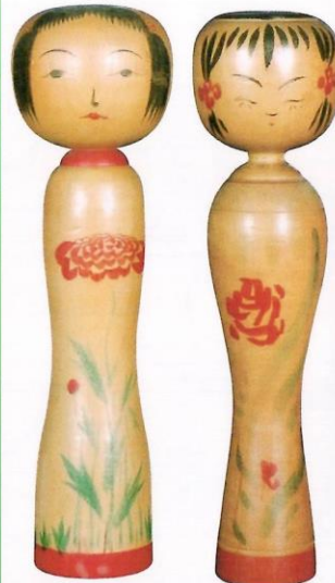
高瀬 善治 1尺2寸 川越 謙次郎 1尺2分