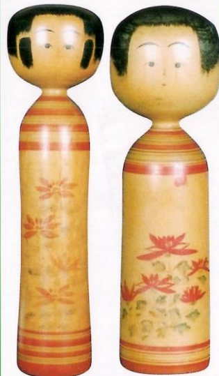
白畑 重治 1尺5寸5分 白畑 重治 1尺