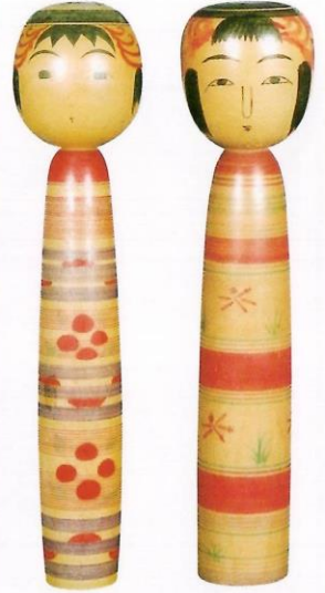
阿部 広史 1尺4寸 阿部 新次郎 1尺3分