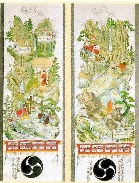
曾我兄弟討入・富士の巻狩図 芳湯一聲筆