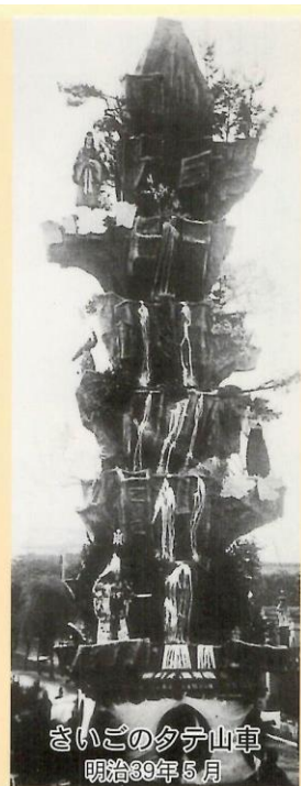
さいごの夕テ山車 明治39年5月