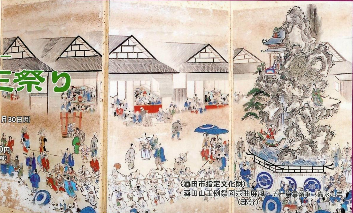
《酒田市指定文化財》 酒田山王例祭図六曲屏風 五十嵐雲嶺筆・嘉永4年 (部分)

酒田市一番町8-16 TEL (0234)24-6544 FAX (0234)24-6544