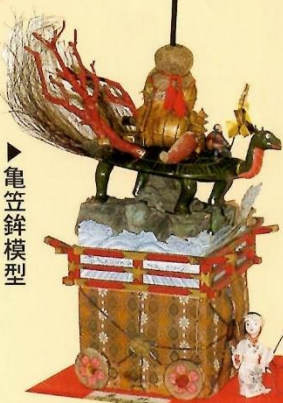
▶亀笠鉾模型 (昭和二八年製作)