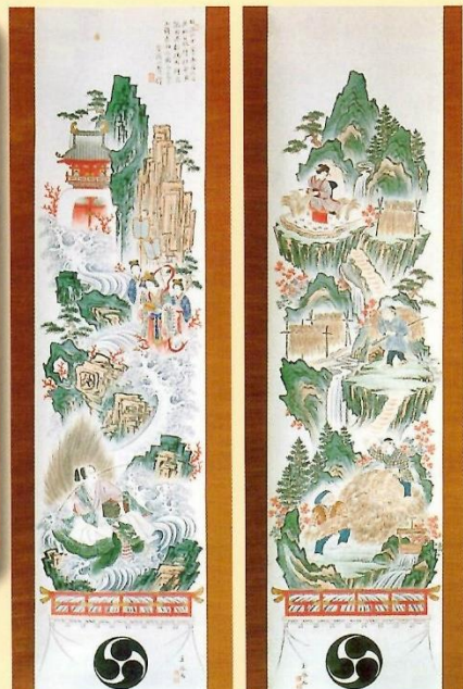
浦島龍宮城図・収穫の図 明治40年 芳渕一聳筆