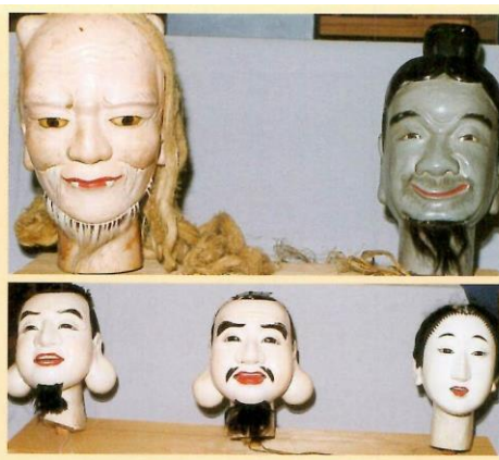
酒田山王祭山車頭