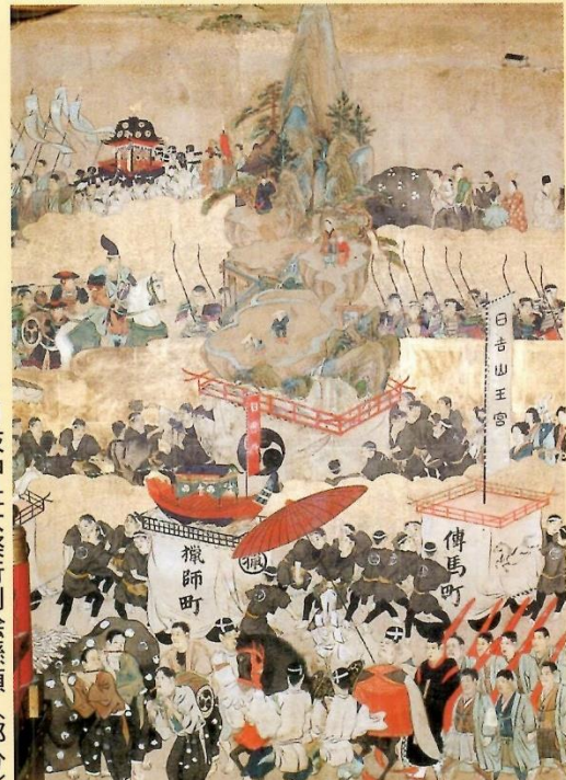
▶日枝神社大祭行列絵懸額 (部分) 下 日枝神社 明治二五年加藤雪窓筆