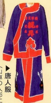
▶唐人服 (山車の人形に使用)