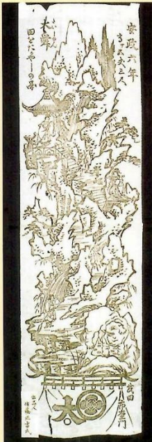
大舜田をたがやしの図 安政6年