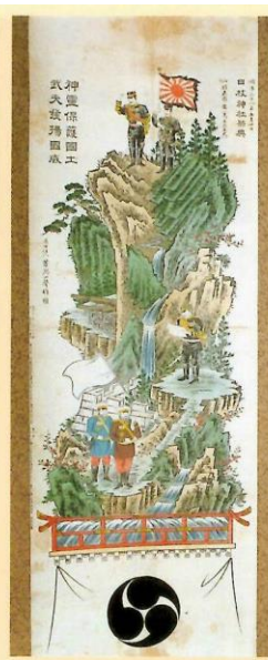
日露戦争の図 明治38年 芳湯一聲筆