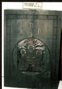
湯殿山御潭佛 名号曼荼羅