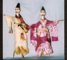
ホンテ人形(宮野浦)