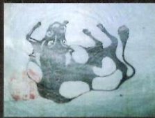
神牛 (羽黒山・月山・瀬殿山)