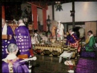
海向寺祈禱祭(豆まき)2月18日