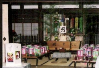
海向寺淡島観音精霊流し8月1日~3日