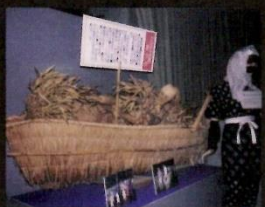
てんのうさま(遊擗部)