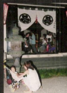
海向寺即仏堂(淡島観音)