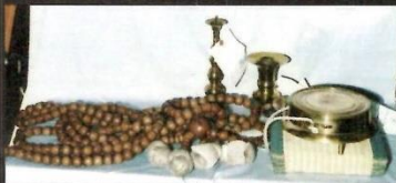
念仏講百万遍数珠と鉦