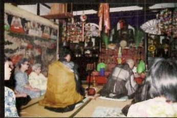
十王堂祈禱祭8月16日