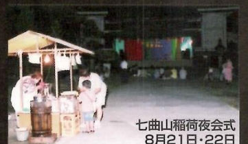
七曲山稻荷夜会式 8月21日・22日