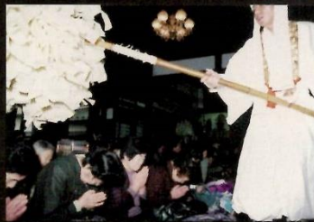
海向寺 千枚梵天の厄払い2月18日