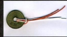
上棟祭の時に撒かれた五円玉