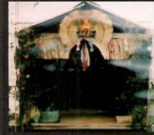
塞道小屋(大宮) 昭和56年2月