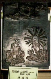
湯殿山人権奥 弘法大師 尊像