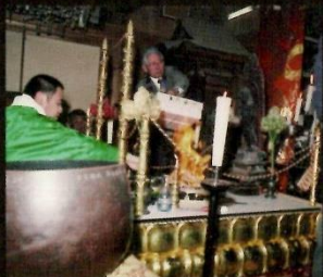
亀ヶ崎十一面観音星祭祈禱