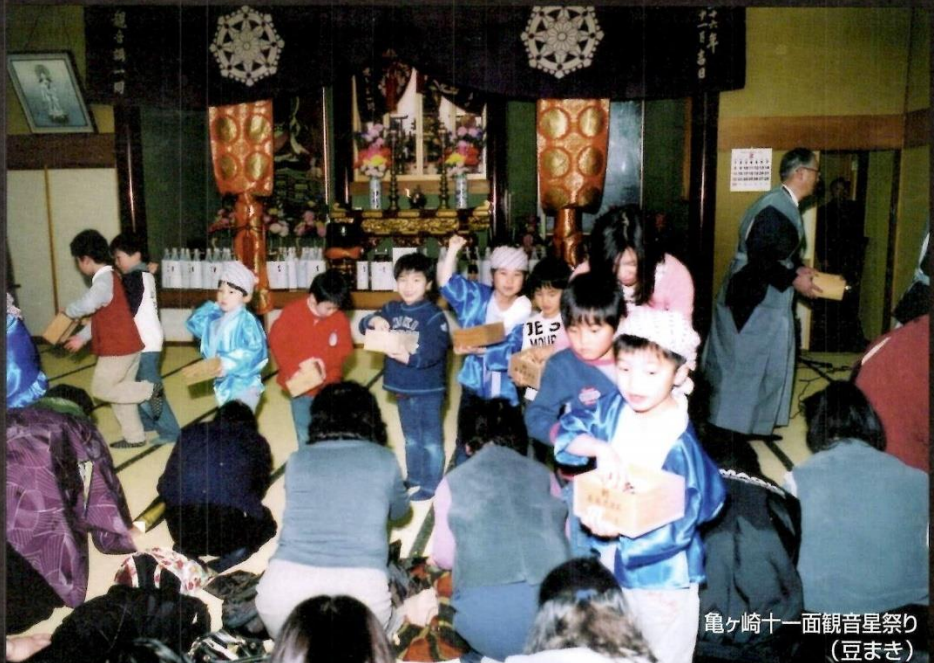
亀ヶ崎十一面観音星祭り (豆まき)