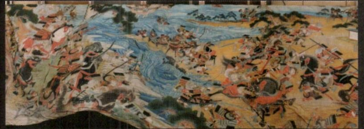
屋島合戦の塞道絵幕(実小路)