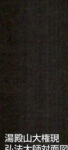
湯殿山大権現 弘法大師対面図