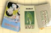
米ノくり(パンレット)