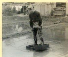
おおあしふみ(田下駄)