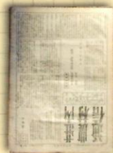
荘内農村通信 (昭和23年代)