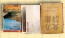
眞壁仁、農村を詠んだ詩集 (大正3年)