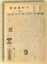
農業荘内 (昭和33年代)