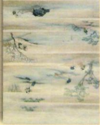
稻生育診断表 (昭和32年代)