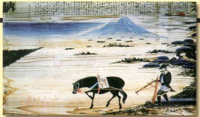
絵馬「乾田馬耕」酒田市板戸 住吉神社