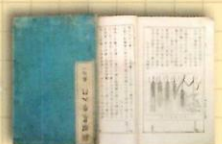
新選農学入門 (大正3年)