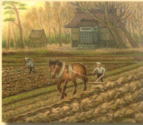
五十嵐 豊作 画「馬耕」

開催期日 平成16年12月2日(木)～17年2月13日(日) 開館時間 午前9時から午後4時30分 休館日 月曜日、月曜祝日の場合翌日休館 12月29日(水)～1月3日(火) 入館料 大人100円、児童・生徒50円 (65歳以上の方と身体障害者の方は無料)