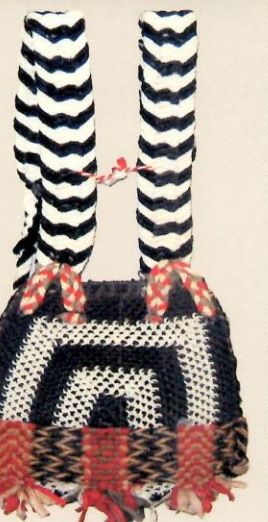
ころばんどり 致道博物館蔵