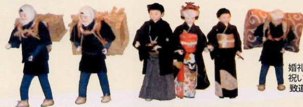
婚礼の時に使われた 祝いばんどり 致道博物館蔵