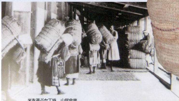
米を運ぶ女丁持 山居倉庫