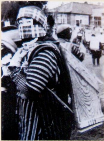
ばんどりをを使って砂運びをする人 浜中