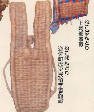
ねこばんどり 旧阿部家蔵