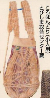
ころばんどり(小入用) とびしま総合センター蔵