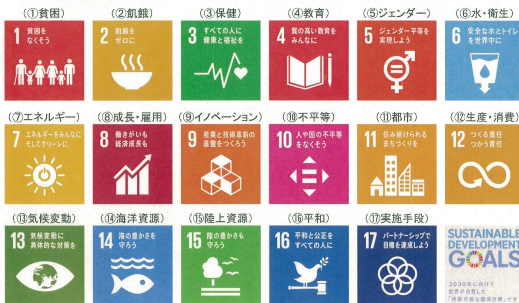
ロゴ：国連広報センター作成