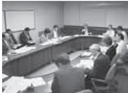
▲10月31日第1回法人設立準備会

11月1日、市立酒田病院から県立日本海病院に派遣される22人の看護師の辞令交付式が行われました。