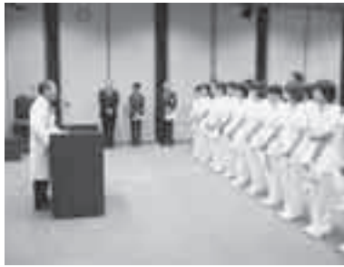
■統合病院の円滑な移行のために

準備会は、理事長予定者、副理事長予定者を中心にして11人の委員で構成され、法人で定める中期計画・年度計画の検討、統合再編の基本計画、就業規則などの法人の規程整備などがこの準備会で協議する事項として、確認されました。また、平成20年度～22年度までの診療科等の移行計画、今後の施設整備計画、法人職員の加入共済組合について協議が行われました。