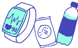
ウェアラブル端末、 応急セット