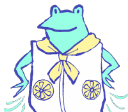
ファン付きウェア、 ネッククーラー