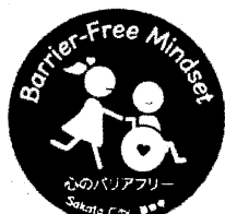
▲酒田市中心のバリアフリーシンボルマーク