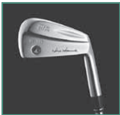
酒田工場設立30周年記念モデルのゴルフクラブ PP-737 30th SAKATA