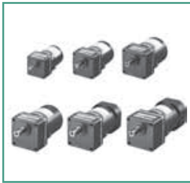
AC小型標準モーター KIIシリーズ