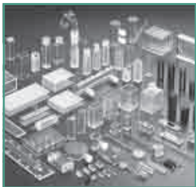
石英精密加工製品 (製品は一辺の長さが数ミリ mm ～数10ミリ mm です)