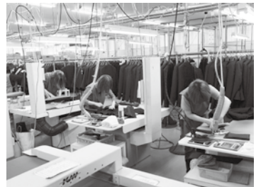
1着1着丁寧に検品し、仕上げのプレス掛けを行っています