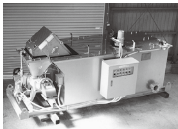
ステンレス製の除塵装置