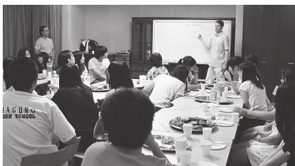
「グローバル・セミナー」の様子 高校生と大学生が楽しく英語漬けの2日間を過ごしました。

市と大学が一体となって政策課題を検討・解決する仕組みとして調査研究事業を平成18年度から実施しており、10年間で20件の調査研究に取り組みました。今年度試行的に行った「グローバル・セミナー」では、本市の未来を担うグローバル人材育成のノウハウを得ることができました。