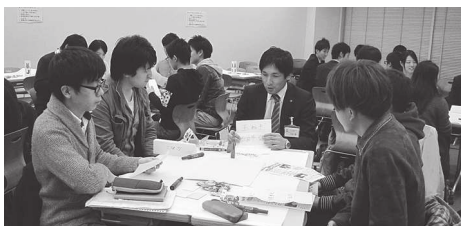
「公務員を目指す学生のための就活サポートセミナー」の様子 公務員が仕事のやりがいなどを熱く語り、学生も気になることを積極的に質問しました。

公務員を志望する学生をサポートするため、山形県庄内総合支庁と庄内2市3町が協力して「公務員が仕事のやりがいなどを学生に伝えるワークショップ」を開催。学生の意向向上につながりました。 また平成28年度からは、新たに採用した市職員が東北公益文科大学に入学できる制度を設けました。公益の視点によるまちづくりのノウハウを地元大学で体系的に習得することにより、地域を先導する人材の育成が期待されます。