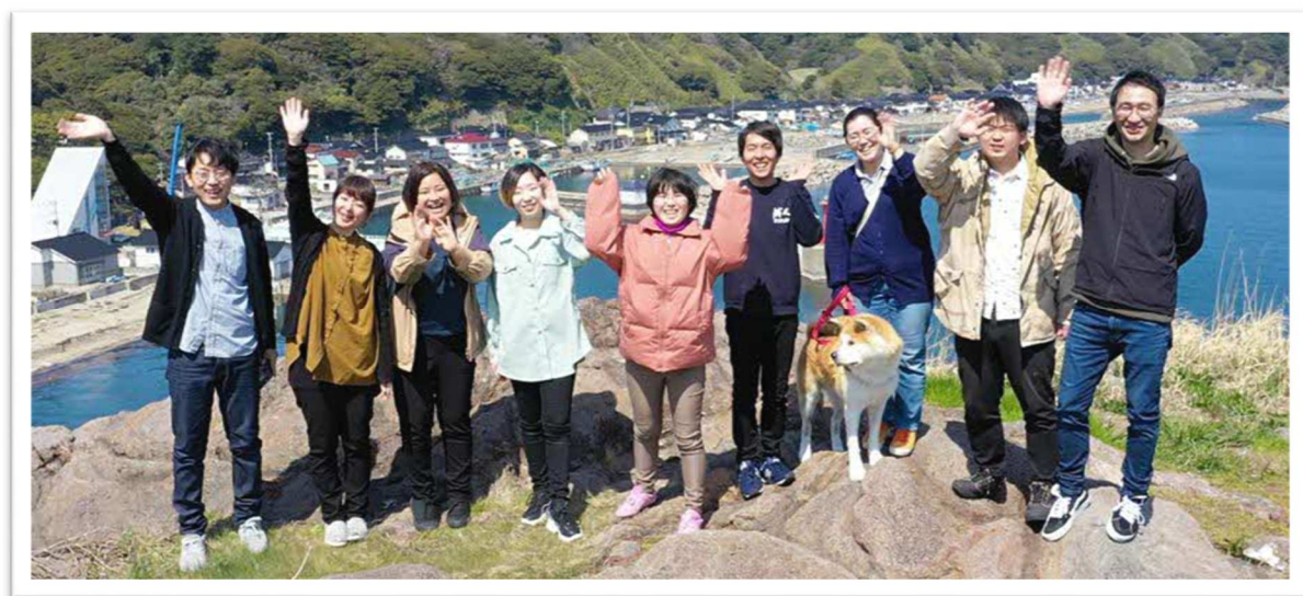
飛島で活動している移住者のみなさん

現在、飛島地域の小中学校は休校中です。文化・伝統を絶やさないよう、学校行事として行っていた文化祭をコミュニティ振興会で引継ぎ、島の文化祭として開催しています。冬期間は、家にこもりがちな島民の健康づくりの場として、月一回の軽スポーツ大会なども企画しています。