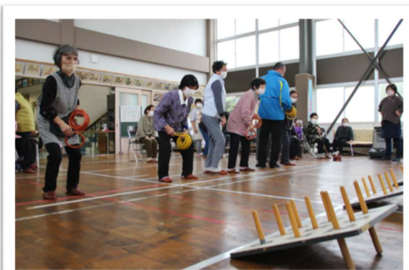
【いわゆり祭】島の文化祭