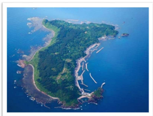
上空から見た飛島

島全体が自然の宝庫であり、鳥海山・飛島ジオパークや国立公園となっており、全国から大勢のバードウォッチャーが訪れます。また釣りの聖地としても有名で、複数回訪れるつり客も多いです。また、飛島と佐渡島だけに自生するトビシマカンゾウやトビシマナシなど、「トビシマ」の名を冠した貴重な植物が自生しています。