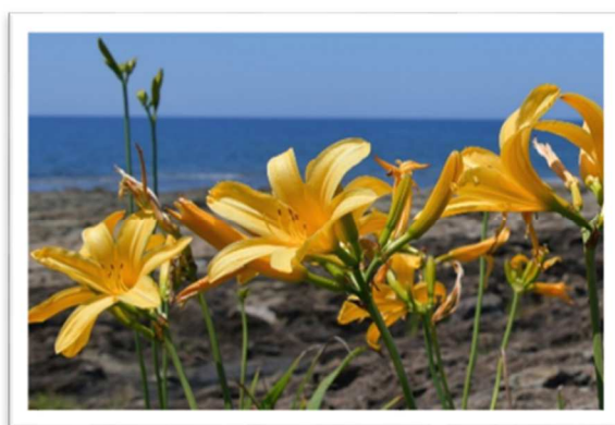
トビシマカンゾウ