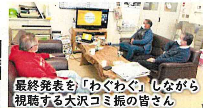
最終発表を「わぐわぐ」しながら視聴する大沢コミ振の皆さん

NPO法人ETICが主催する「地域イノベーター留学」。大沢コミュニティ振興会・合同会社COCOSATOが受け入れ団体となり、北海道、東京、千葉から合格した3名の皆さんが「大沢地区とつながるファンづくり」をテーマに、4ヶ月間に渡り企画を検討。12月19日にオンラインでイノベーター生による「わぐわぐ」する内容の最終発表がありました。