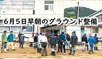
6月5日早朝のグラウンド整備