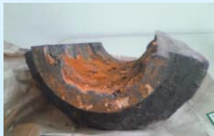
錆ついた老朽管(イメージ)