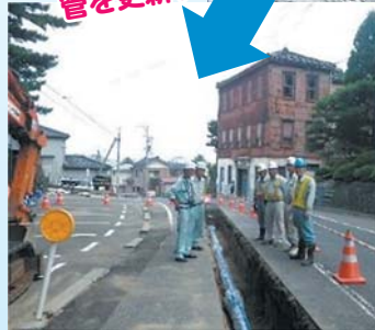
老朽管更新工事(平成25年)

水道事業創設時に布設された水道管は、内側に錆が付着し、にごり水の原因となっていました。現在更新している水道管は、内側に特殊な塗装が施されており、写真のような錆がつくことはありません。