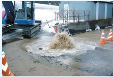
水道管破裂(イメージ)