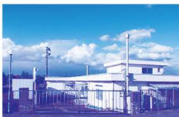
農業集落排水処理施設