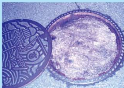
下水道本管マンホールに詰まった油(ラード)のかたまり