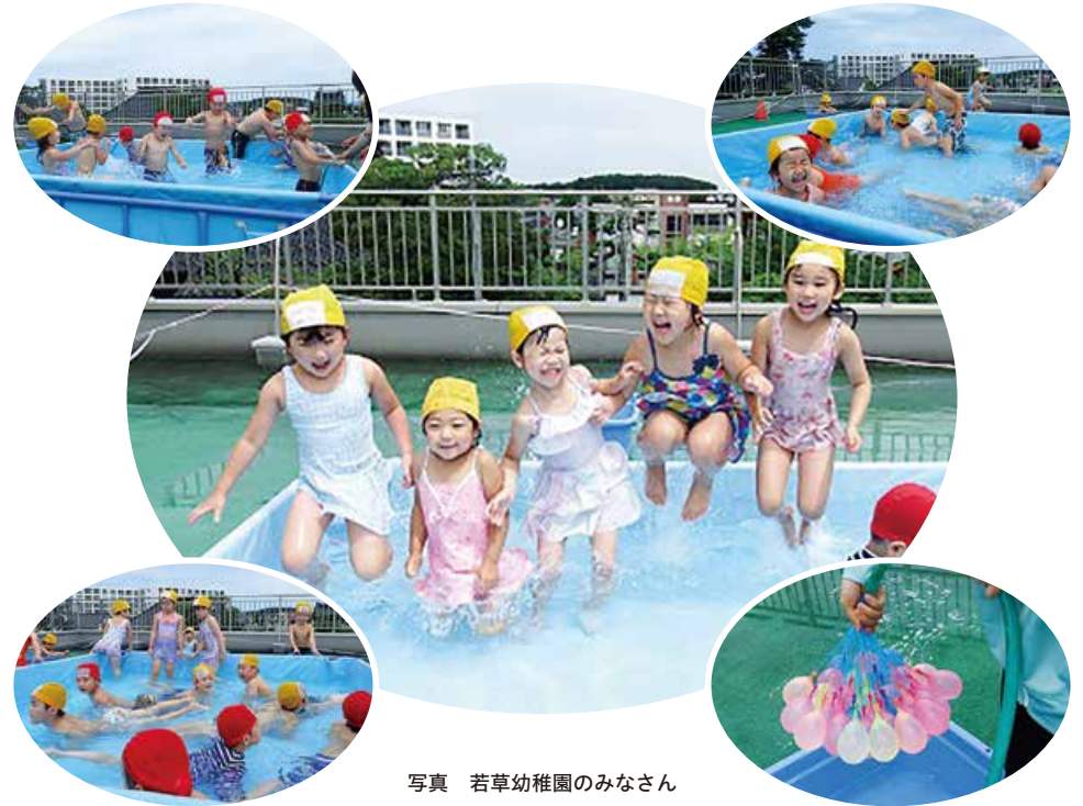
写真 若草幼稚園のみなさん

編集・発行 ● 酒田市上下水道部 酒田市末広町14-14 ☎0234-22-1832