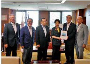
吉村知事に要望書を手渡す 丸山市長、市議会議長、地元選出の県議会議員