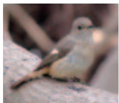
ジョウビタキ(メス)