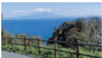
鼻戸崎展望台(遠方には鳥海山が見える)

鼻戸崎の眼下に広がる海の色はコバルトブルーです。以前、一口アワビの養殖をしていたときに、水の流れを良くするために掘削した結果、このようになりました。