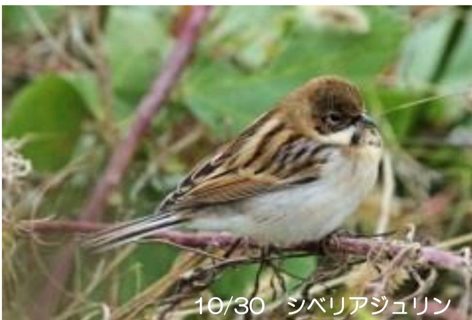
10/30 シベリアジュリン