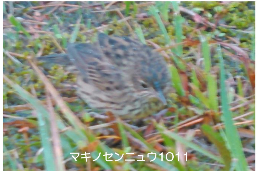
マキノセンニュウ1011

情報 10/9 チフチャフ1 (2の畑)、 10/10 アナドリ1 (航路) ※山形県および飛島初記録