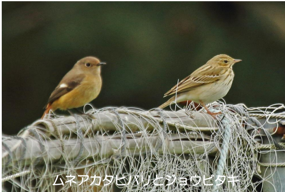
ムネアカタヒバリとショウビタキ