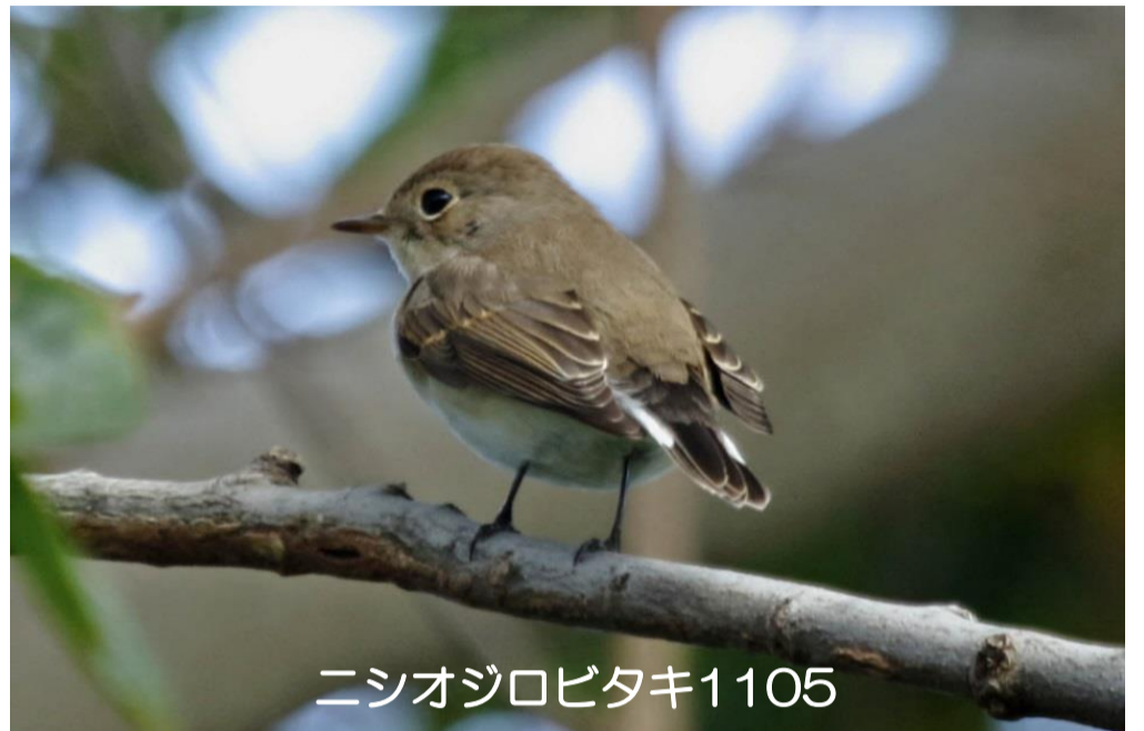
ニシオジロビタキ1105