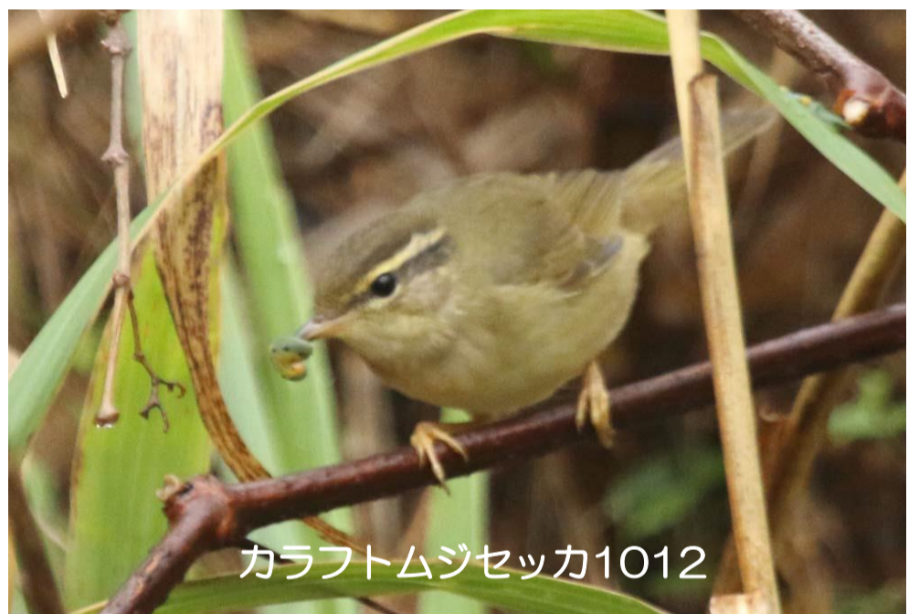
カラフトムジセッカ1012

情報 シベリアジュリン、コホオアカ (ヘリポート)、ムジセッカ、シロハラホオジロ (2の畑)、オジロビタキ (校庭)、ニシオジロビタキ (オジロビタキの森)