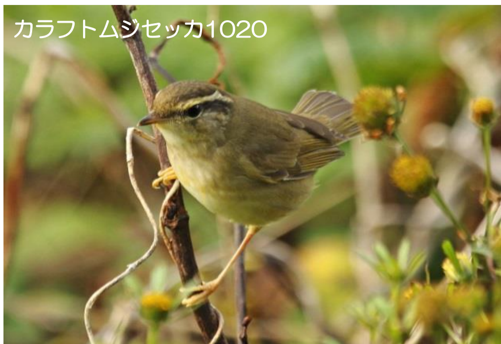
カラフトムシセッカ1020