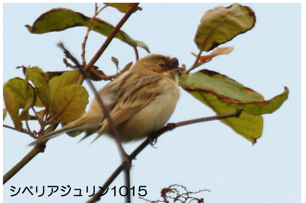
シベリアジュリン1015

10/16 (火) 7:30~8:30、結構な雨が降った。雨が上がったならジョウビタキ激増。