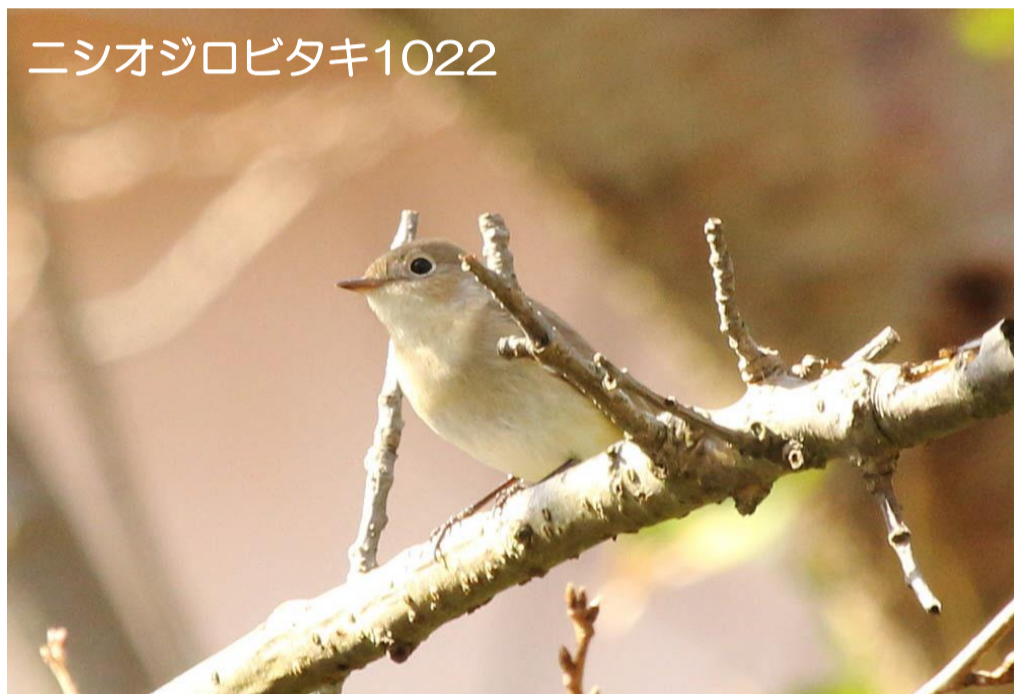
ニシオジロビタキ1022