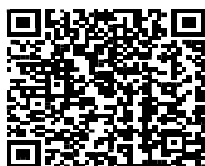
税制対象機械の 一覧はこちら