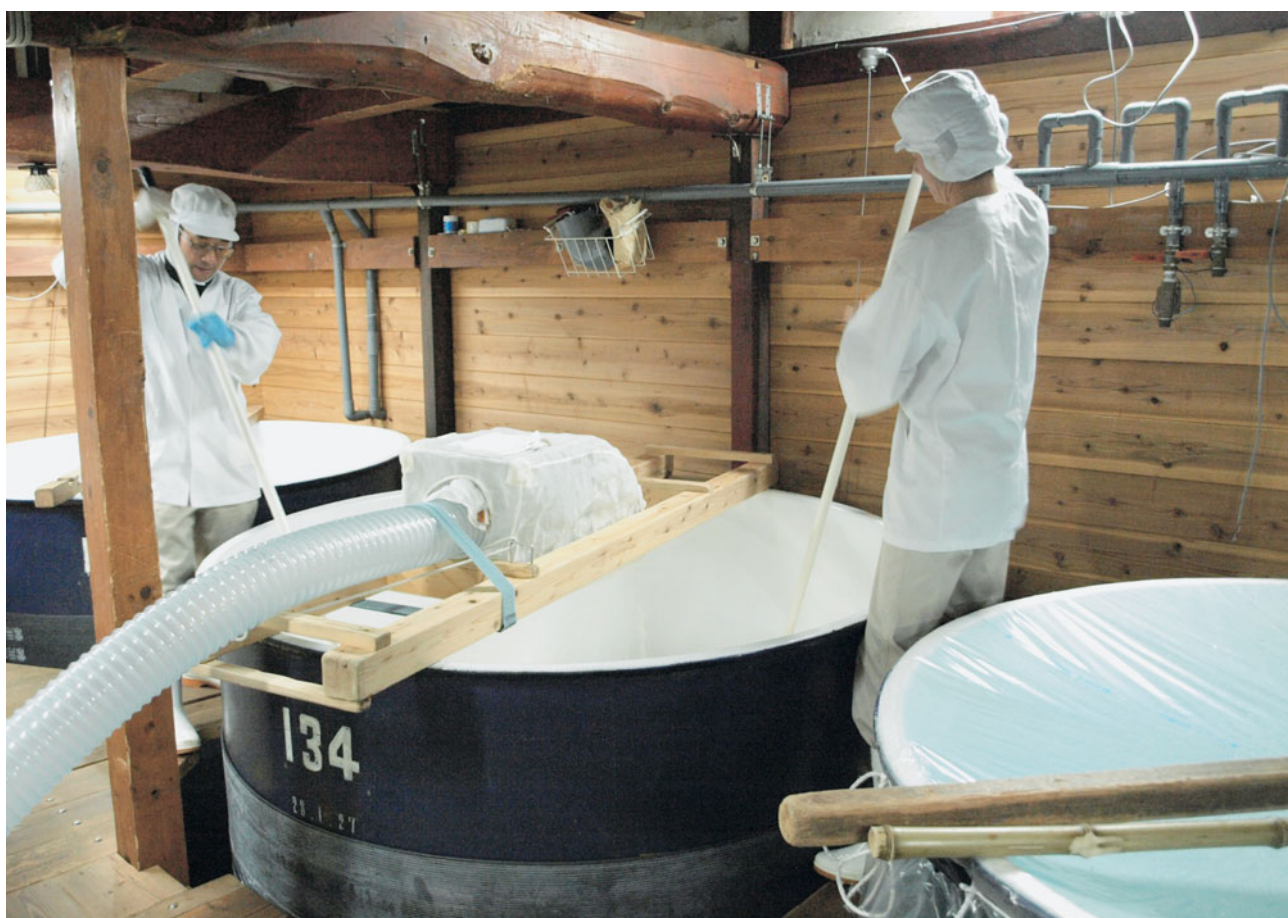
「米の恵みの冬仕込み」 ～地元産酒米を使った清酒の仕込み～