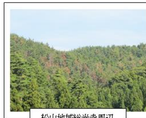
松山地域総光寺周辺