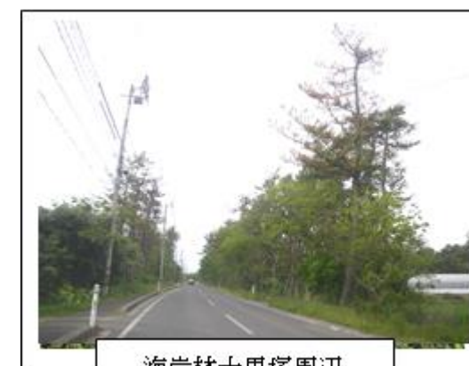
海岸林十里塚周辺

※マツ類の穿孔性害虫。松枯れの原因であるマツノザイセンチュウの媒介者。 （東北森林管理局HPより）