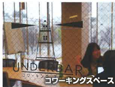
UNDERBAR コワーキングスペース