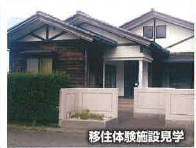
移住体験施設見学