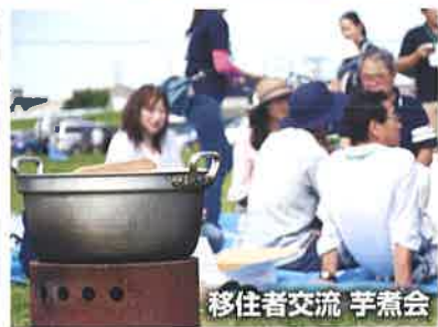
移住者交流 芋煮会