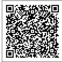
▲新築住宅補助金 ホームページ