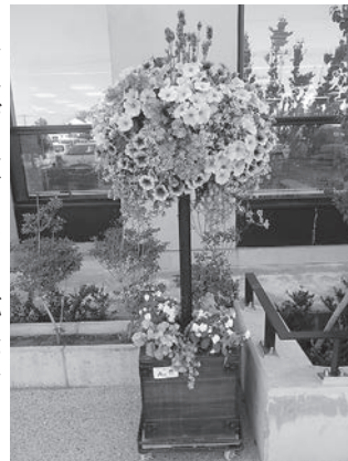
▶スタンディングフラワーバスケット (完成イメージ)