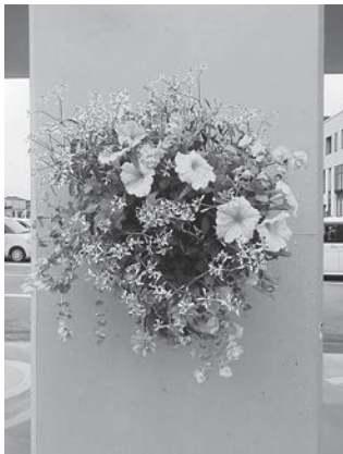
▶ハンギングフラワーバスケット (完成イメージ)