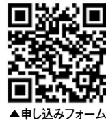
▲申し込みフォーム

内容/変化の時代に対応する心構えや、これからの働き方・職業に対する考え方など ▼費用/500円(軽食代) ▼申し込み/3月8日(金)までサンロクへ ☎2616066