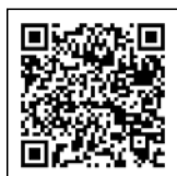
▲県ホームページ QRコード