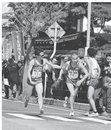
山形県縦断駅伝競走大会市内通過予想時刻