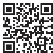
▲酒田水泳教室ホームページ