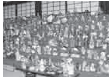
▲個性的な土人形も並びます

庄内一円から寄贈されたお雛様を約600体飾ります。その多くは、江戸時代末期から戦後に作られた瓦人形で、鶴渡川原人形をはじめとする、昔ながらのお雛様が素朴で温かいほほ笑みを浮かべています。