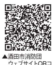
▲酒田市消防団ウェブサイトQRコード