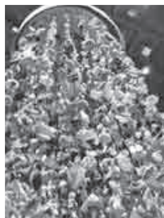
▲彩りとにぎわいをもたらす大型傘福

庄内には古くから庶民の切なる願いを込めた飾り物の傘福があります。旧料亭に「酒田の傘福」を華やかに飾ります。人形作家 辻村寿三郎の「さかたの雛あそび」も常設展示しています。