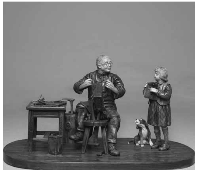
かばん 「靴屋」1992年 個人蔵