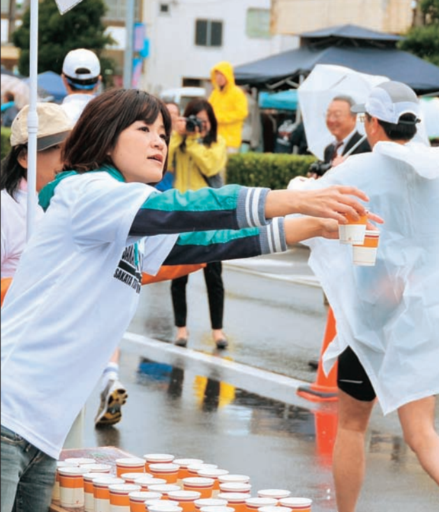
▲ボランティアの皆さんが大会を支えます