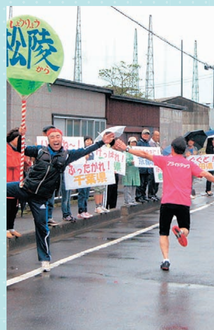
▲思いっきりハイタッチ