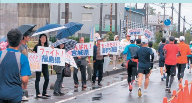
▲故郷のことで「がんばれ!」