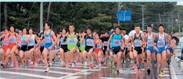
▲3キロ(中学生)の部スタート