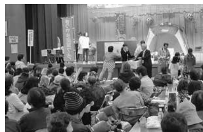
11/9まつやま産業フェア