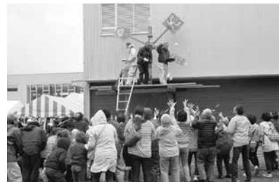
11/3ひらた文化祭・産業まつり