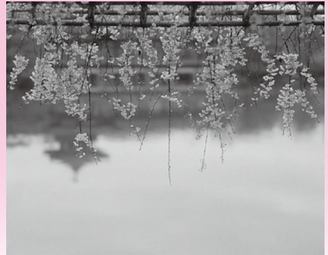
▲塔影 京都平安神宮

古寺や焼き物の撮影の合間に、そのとき惹かれた風景を撮影していた土門拳。ファインダーをキャンバス代わりに、土門だけの感性で切り取られたさまざまな風景写真をお楽しみいただけます。