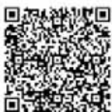
▲市ホームページQRコード