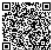
▲ふるさとチョイスQRコード

※1月4日(日)まで閉庁。1月5日(月)正午から申し込みを受け付けます。 ◆詳しくは市総務課総務係へお問い合わせるか、市ホームページをご覧ください。 ◆個人がふるさと地方公共団体に寄付した金額を確定申告することで、金額に応じて住所地の個人住民税や所得税が軽減されます。