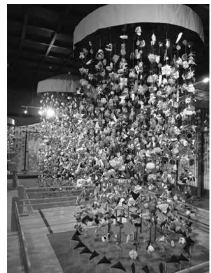
▲日本三大つるし飾り 酒田の傘福