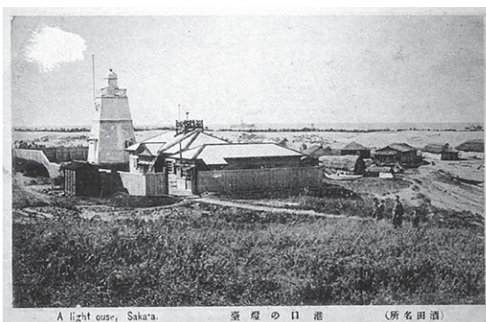
▶大浜にあった六角灯台が写る絵はがき