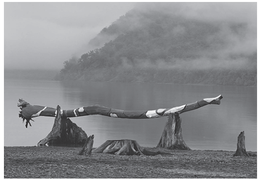
「勅使河原蒼風の花」より おろち

土門と勅使河原蒼風、両巨匠のぶつかり合いによって生まれた作品「勅使河原蒼風の花」、彫刻と詩人、そして写真家・土門拳のコラボレーションを楽しめる「箱根の森 彫刻と詩」を展示します。