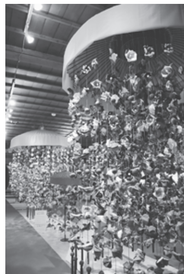
◀日本三大つるし飾り酒田の傘福