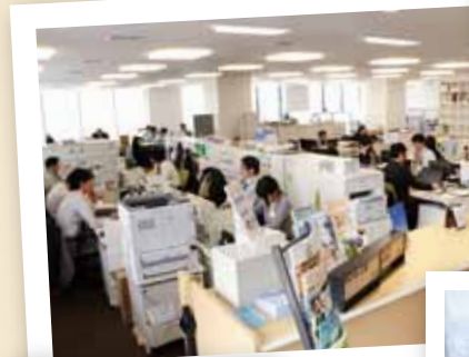
1 4階フロアの様子 間に壁はなく、仕切りはキャ ビネット。奥まで見渡せます。