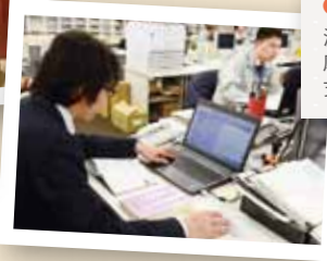
4 緑の下の力持ち 法律や職員の福利 厚生などで市役所を 支えています。