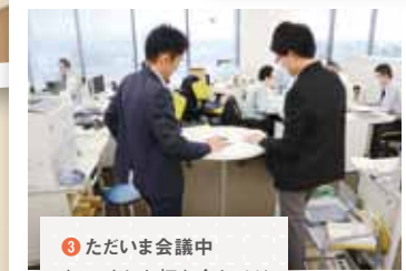
3 ただいま会議中 ちょっとした打ち合わせは 立ったままですることも。