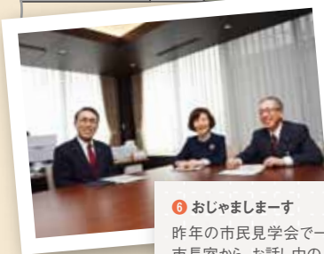
6 おじゃまします 昨年の市民見学会で一番人気だった 市長室から、お話し中のところをパチリ。